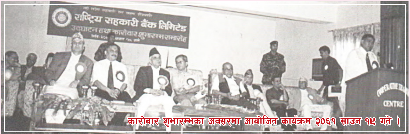
कारोबार शुभारम्भका अवसरमा आयोजित कार्यक्रम २०६१ साउन १५ गते ।

लाख ८९ हजार ४ सय ९४ रुपैया कर्जा लगानी रहेको थियो। निरन्तर सदस्य, शेयर पूँजी, निक्षेप, कुल कारोबारमा वार्षिक रूपमा वृद्धि गर्दै आर्थिक वर्ष २०७४/०७५ को अन्त्यसम्म करिव १० हजार शेयर सदस्यवाट १ अर्व भन्दा बढी शेयर रकम, करिव २० अर्व निक्षेप, करिव १३ अर्व कर्जा लगानी गर्न बैंक सफल भएको छ। यो आर्थिक वर्षमा बैंकले २९ करोड ५० लाख रकम नाफा गर्न सफल भएको छ। आ.व. २०७३/०७४ मा आफ्ना सदस्य संघ संस्थाहरुलाई १४ प्रतिशत मुनाफा वितरण गरेको बैंकले २०७४/०७५ को